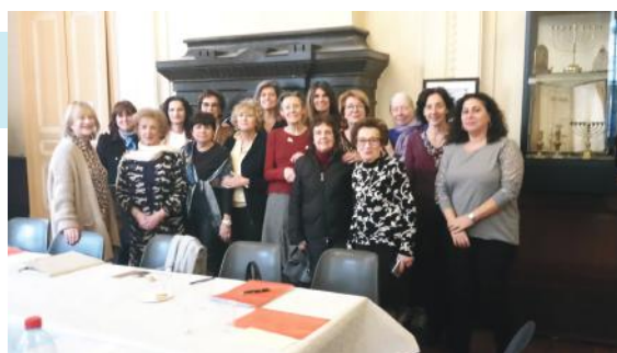
Grande réunion lors de l'Assemblée Générale ce 19 Février