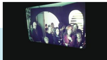
Retour dans les années 60, en images et en musique Expo « Révolutions » ce 24 février