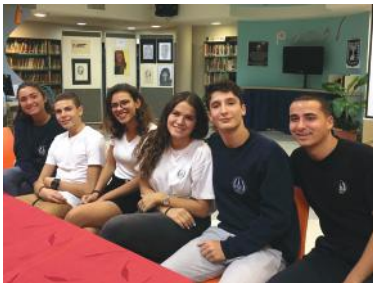
Quelques jeunes francophones du programme Naale