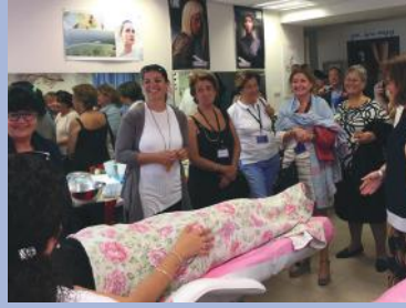
Salle de cours d'esthétique