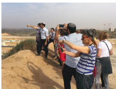
Visite de Sderot avec l'adjoint au maire et explications sur Gaza