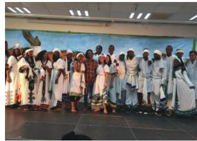
Fête éthiopienne du Sigd