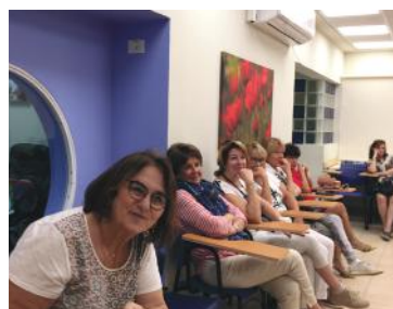
Centre WIZO aide aux familles traumatisées