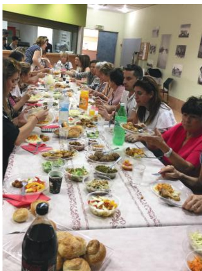
Déjeuner préparé par des habitantes de Sderot